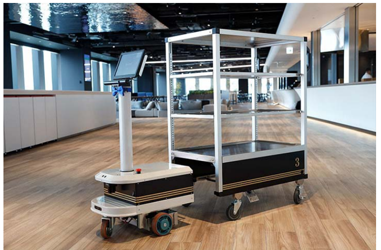
自主運輸車。用平板電腦操作的機器人（照片左）牽引著小推車（照片右）。機器人與小推車可分離