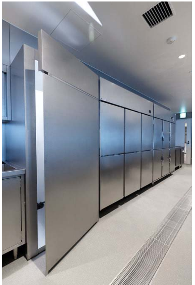
面臨自助餐廳旋轉餐台的冷藏庫和保溫櫃。近前亮著照明的門是通往主廚房。每台設備都進行了沉穩的振動拋光研磨。

首先是碗盤清洗區。這是運用機器學習 (AI) 和機器人技術，自動對清潔後的碗盤進行分揀的機器人「finibo」。隨著出生率下降和老齡化日益加劇，未來餐飲服務業界人手不足的趨勢將更加顯著。碗盤的清潔和分揀是尤其令人擔心工人短缺的工種之一，因為碗盤洗碗機排出的蒸氣和熱氣等導致環境高溫多濕，而且需要站立工作。