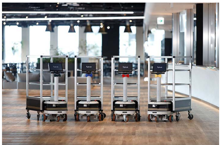
模仿飯店禮賓車的 4 台自主運輸車活躍運行中。外形的樹脂成型部分是由五十鈴自動車的設計中心設計的。